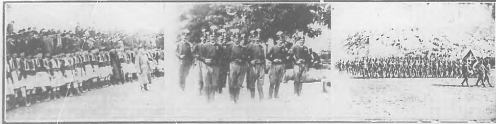
Un puesto avanzado que acaba de ser destruido.—El cuerpo del rey Nicolás de Montenegro.—Destile de tropas montenegrinas que se dirigen á la frontera.