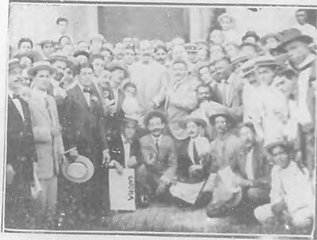
En honor del general Asbert. —Con motivo de celebrar su fiesta doméstica el general Asbert fué agasajado por los empleados del Gobierno Civil con un suculento almuerzo en el restaurant del Hotel Inglaterra. El acto resultó sumamente lucido y afectuoso.

El regalo del pasado mes tocó en suerte á la suscriptor Amparo Lezama de Berdegón, vecina de la calle de Zanja 137, que tenía en su recibí el número 9174, igual á los cuatro terminales de pesos de la recaudación de la Aduana de todo el pasado mes de Octubre, y á quien se le han entregado los muebles que se sorteaban.