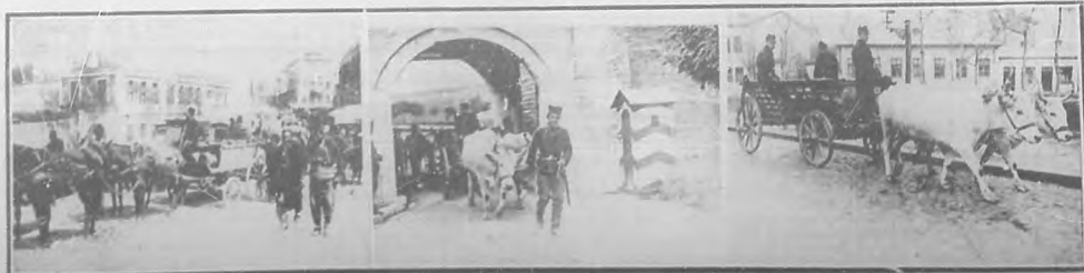
El carro de transporte militar del ejército serbio.—Un carro de transporte militar del ejército turco.—Un carro de transporte militar del ejército búlgaro.