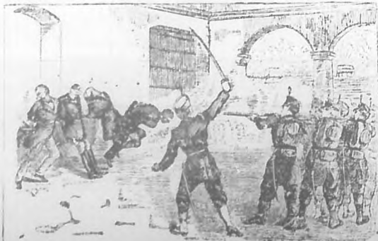
Acto de la ejecución de "Bombeta" O'Ryan, Sol y Céspedes.