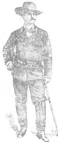
General Corrado Varona (Bombeta)

Persecución y caza del "Virginus". —A las cuatro de la tarde del día 31, la voz del sobreviola anunció un vapor á la vista hacia el Suroeste. Á su lontananza se divisaba una línea de humo, pero nadie sintió ansiedad por esto, hasta que el rumor de las palabras hizo comprender á muchos que era un buque de guerra español. Fry dijo: no se podía conocer lo que el buque español haría. El vapor está á diez