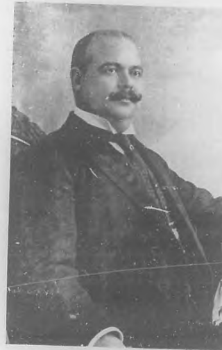
General Ernesto Asbert y Díaz. Exelecto Gobernador de la Provincia de la Habana.

Consecuencia del triunfo de la Conjunción en las recientes elecciones ha sido la continuación en su puesto de Gobernador de la Provincia del general Ernesto Asbert, y continuación, por lo tanto, de una gestión que solo ha merecido elogios en el ejercicio finido y que, desde luego, seguirá mereciéndolos en el próximo.