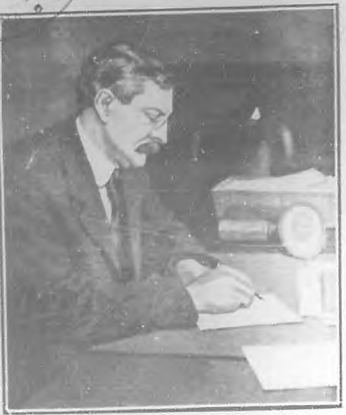
Mr. Marshall Electo Vice-Presidente de los Estados Unidos del Norte América.