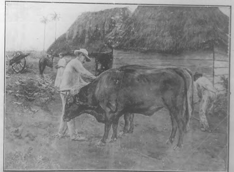
"EL AMANECER EN EL SITIO",—Cuadro de Armando Menocal. Gran Premio en el Concurso celebrado por la Academia de Artes y Letras.