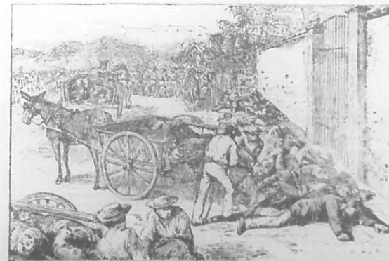
Carretillas, recogiendo los cadáveres de la última ejecución efectuada el 8 de Noviembre.

Esa fué la mejor diplomacia, así logró salvarse de la carnicería el resto de la tripulación.