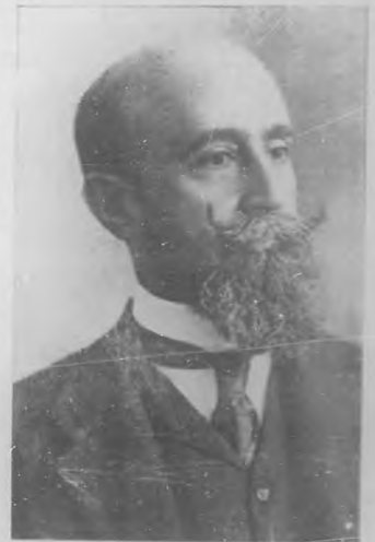
General Fernando Freyre de Andrade. Exelecto Alcalde de la ciudad de la Habana.

También en los Estados Unidos de Norte América la política ha sufrido como en Cuba, un cambio radical con motivo de las elecciones.