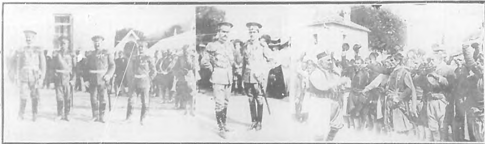
El Estado Mayor del Ejército montenegrino.—Los príncipes Danilo y Pedro hijos del rey de Montenegro y comandantes del Ejército montenegrino.—El rey Nicolás de Montenegro, aclamado por sus tropas.