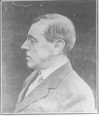
Mr. Woodrow Wilson Electo Presidente de los Estados Unidos del Norte América.

nes que han dado el triunfo al partido demócrata. Publicamos los retratos de Mr. Wilson y de Mr. Marshall, presidente y vicepresidente, respectivamente, electos.