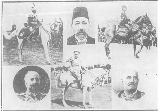
De izquierda á derecha: El Rey de Serbia.—El Sultán de Turquía.—El Rey de Grecia.—El Rey de Bulgaria.—El Ministro de la Guerra de Montenegro.—El Rey de Montenegro.

Así lo anunció, días atrás: á plazo fijo, con una seguridad que maravilla y que prueba hasta qué punto es irresistible el empuje de los bravos búlgaros, serbios, montenegrinos y griegos, y cuánta confianza tiene el Czar búlgaro en la acción combinada y eficaz de los ejércitos aliados contra el imperio otomano.